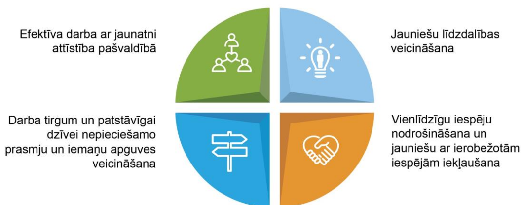
Attēls Nr. 1. JPAP rīcības virzieni