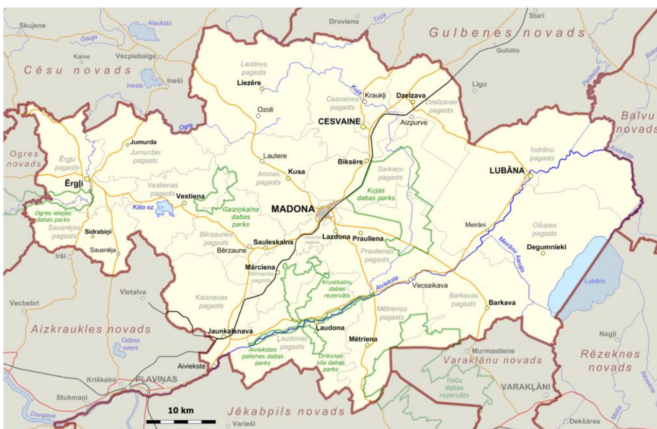
Attēls Nr. 2. Madonas novada teritoriālais attēlojums

Novada administratīvais centrs ir Madonas pilsēta. Madonas novadā apvienoti 19 pagasti (Aronas pagasts, Barkavas pagasts, Bērzaunes pagasts, Cesvaines pagasts, Dzelzavas pagasts, Ērgļu pagasts, Indrānu pagasts, Jumurdas pagasts, Kalsnavas pagasts, Lazdonas pagasts, Liezēres pagasts, Ļaudonas pagasts, Mārcienas pagasts, Mētrienas pagasts, Ošupes pagasts, Praulienas pagasts, Sarkanu pagasts, Sausnējas pagasts, Vestienas pagasts un 3 pilsētas (Madona, Cesvaine, Lubāna).