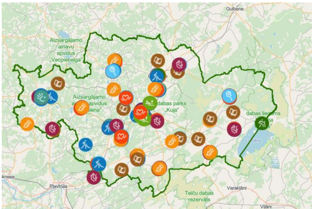
Attēls Nr. 5. Madonas novada resursu karte

Detalizētāka informācija par konkrētām vietām pieejama Madonas interaktīvajā kartē: Madonas novada resursu karte.